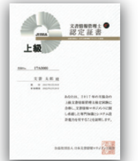
文書情報管理士認定証書