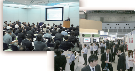
東京ビッグサイト会場風景（3日間開催）

※2018年より、eドキュメントJAPANは「デジタルドキュメント」に改称いたしました。