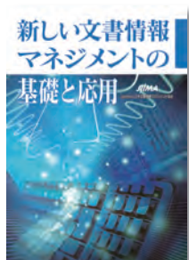
新しい文書情報マネジメントの基礎と応用