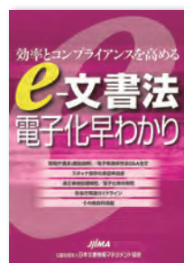
効率とコンプライアンスを高める e-文書法 電子化早わかり