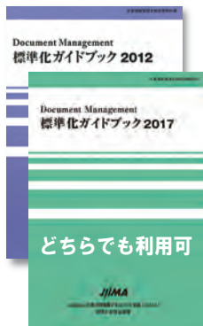
標準化ガイドブック 2012 または 標準化ガイドブック 2017