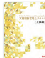
文書情報管理士テキスト [上級編]