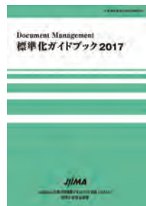
標準化ガイドブック 2017