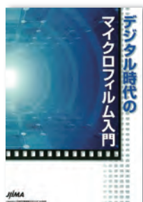
デジタル時代のマイクロフィルム入門